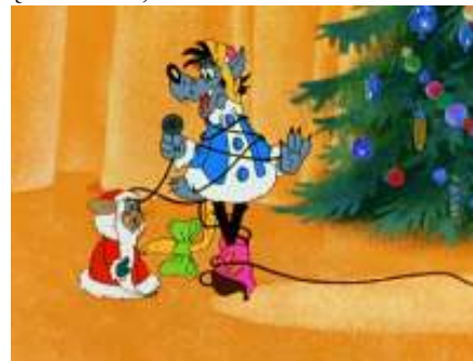
Persiskambinęs Jūsų Draivas Padvalinskas

KARNAVALO? - arba – Karnavalai, labai prašau, atėik ir padaryk mūsų pasaulį teisingą. Staiga prisiminiau seną „Na, palauk“ filmuko seriją, kurioje vaikučiai, meškučiai ir kiškučiai taip mielaširdingai šaukia – Snieguole! Snieguole! (originalo kalba – „Snigūračka!) O, kad mane, arba nors poną Karnavalą, taip pakviestu... Palaukit, man skambina. Alio?